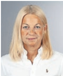
Claudia Schmelzer

Leuten aus dem Viertel für das Viertel. Sie konnten uns mit ihrem Konzept am meisten überzeugen. Es setzt auf einen gelungenen Mix aus einer Art genossenschaftlichem Wohnen, günstigem sowie sozialem Wohnraum und betreutem Wohnen. Auch das Thema Barrierefreiheit wird unmittelbar mitbedacht, was ganz im Sinne des Inklusionsgedankens ist. Die Bestandsgebäude