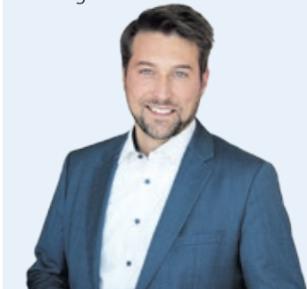
Uwe Conradt Oberbürgermeister der Landeshauptstadt Saarbrücken

Ich wünsche Ihnen schöne, entspannte und abwechslungsreiche Herbsttage!