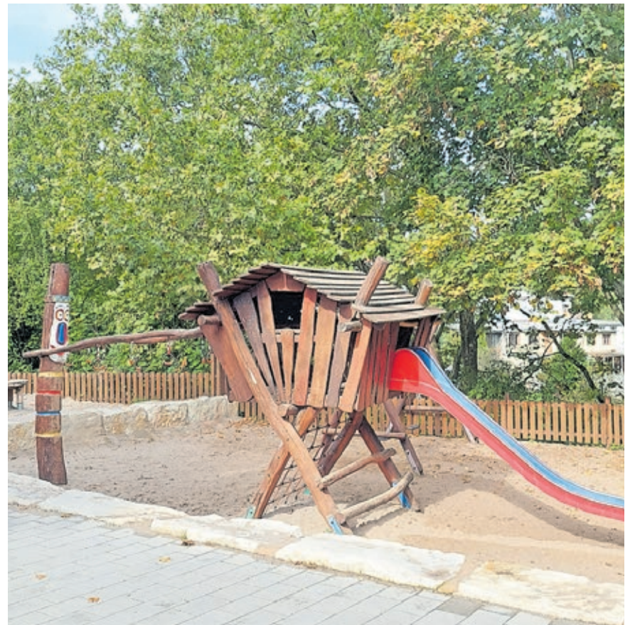
Der neue Sandspielbereich auf dem Abenteuerspielplatz Meiersdell.

Meiersdell wurde als erster Spielplatz dieser Art in der Landeshauptstadt Saarbrücken im Jahr 1976 in Betrieb genommen. Die Einrichtung ist als offenes Kinder- und Jugendhilfeangebot konzipiert und ein Ort außerschulischen Lernens. Die pädagogische Begleitung durch sozialpädagogische Fachkräfte des Amtes für Kinder und Bildung und die naturnah gestalteten Spiel- und Erfahrungsräume ermöglichen Kindern ein vielfältiges Freizeitangebot.