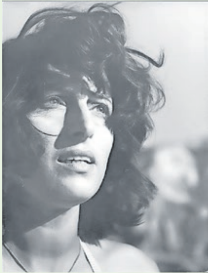
Die italienische Schauspielerin Anna Magnani.

Der Todestag der großen italienischen Schauspielerin Anna Magnani jährte sich am 26. September 2023 zum 50. Mal. Filme wie „Mamma Roma“ oder „Die tätowierte Rose“, für den sie einen Oscar als beste Hauptdarstellerin gewann, machten sie international bekannt. Zu diesem besonderen Anlass bietet die vhs Regionalverband Saarbrücken in Kooperation mit weiteren Partnern eine Veranstaltungsreihe an, die sich dem Leben und künstlerischen Schaffen der großartigen Charakterdarstellerin widmet.