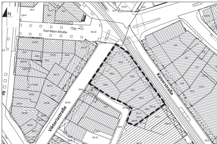
Übersichtsplan ohne Maßstab

Der seit 1969 rechtskräftige Bebauungsplan Nr. 131.02.08-09 „Bahnhofstraße I, Änderung der Baugruppeneinheit Bahnhof-, Viktoria-, Kaiser-, Passagestraße“ setzt für den Bereich des ehemaligen Kaufhauses die Zahl der Vollgeschosse auf VI bzw. V + I sowie in einem Teilbereich eine eingeschossige Hinterhofbebauung fest. Der Investor beabsichtigt die Umsetzung von 6 Vollgeschossen + 2 Staffelgeschossen. Die Planung ist daher mit dem geltenden Planungsrecht nicht vereinbar. Vor diesem Hintergrund soll zur Ermöglichung des Vorhabens das Planungsrecht entsprechend angepasst werden.