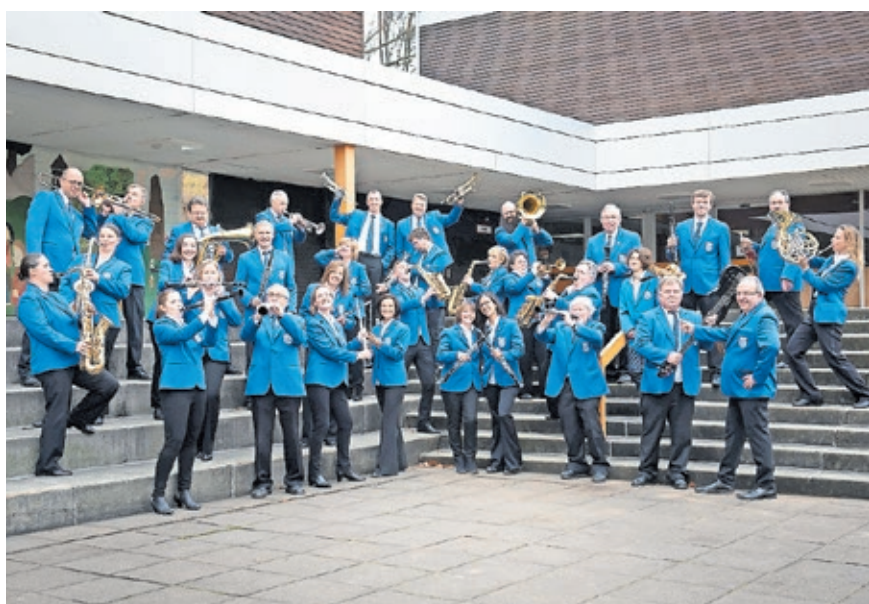
Beim Konzert der Stadtkapelle beim Saarländischen Rundfunk gibt der Swing den Ton an.

Tickets zum Preis von 25 Euro (zuzüglich Vorverkaufsgebühr) gibt es an allen Vorverkaufsstellen von Ticket regional und online unter www.ticket-regional.de .