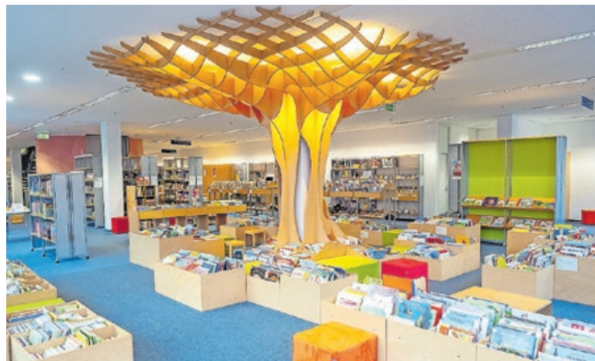
Die Stadtbibliothek Saarbrücken lädt Besucherinnen und Besucher am „Tag der Bibliotheken“ zu abwechslungsreichen Aktionen ein.