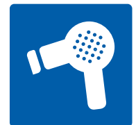
Elektrokleingeräte können auch in der Wertstofftonne entsorgt werden.