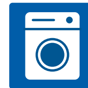
Elektrogroßgeräte (z.B. Waschmaschine, Kühlschrank etc.)